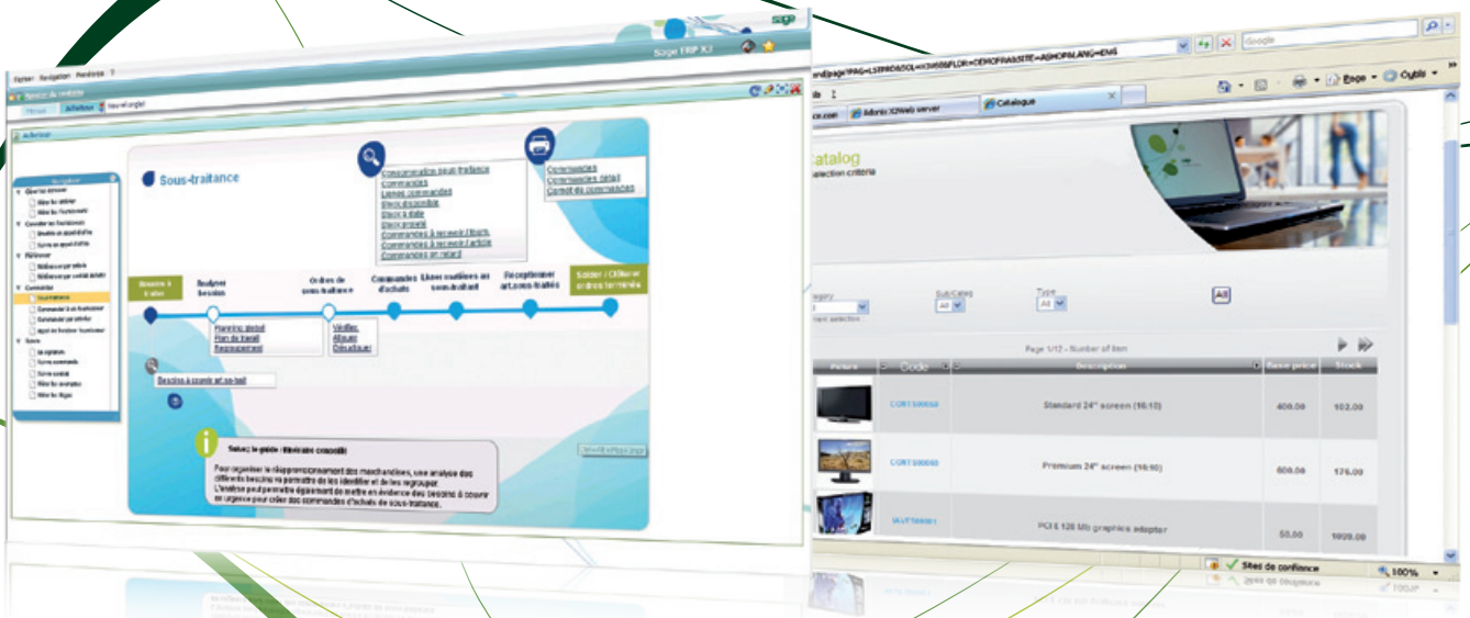
Cet écran illustre un processus de la gestion de la sous-traitance.

Utilisateurs finaux : • Interfaces utilisateur • Concepts basés sur les rôles • Personnalisation • Fonctionnalités de collaboration • Facilité d’utilisation • Fonctionnalités d’analyse mieux intégrées • Accès occasionnel au système ERP.